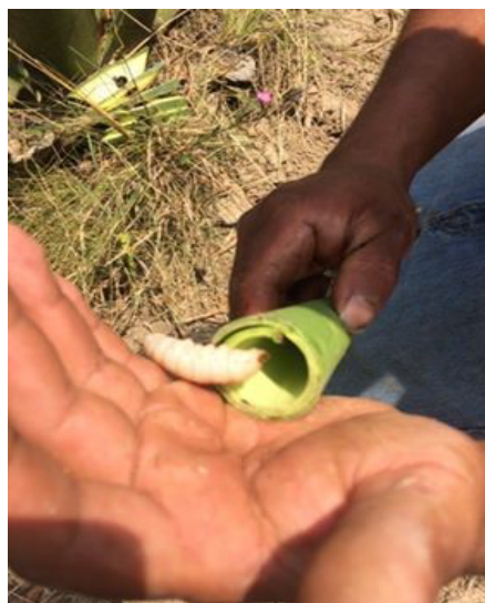
Figura 2. Transporte del gusano de maguey ( Aegiale hesperiaris ) en una “capucha de maguey” foto de Daniel Victoria.

Otros artrópodos hospederos de los agaves en San Pedro Arriba son los chicuil , ( Scyphophorus acupunctatus ) y las larvas de bz bz (larvas de himenóptero). El primero denominado también “botija del maguey” (Ramos-Elorduy et al. , 2006) y “picudo” (Solís et al. , 2001). Contrario al gusano de maguey ( Aegiale hesperiaris ), el picudo es una de las principales plagas del cultivo del agave, en particular del Agave tequilana (Solís et al. , 2001); este artrópodo se emplea habitualmente para dar sabor al mezcal.