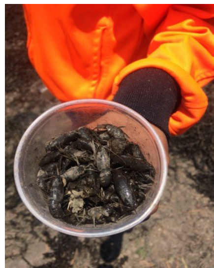
Figura 3. Transporte de acocil ( Cambarus sp.) y padrecitos ( Anax sp.) foto de Daniel Victoria.